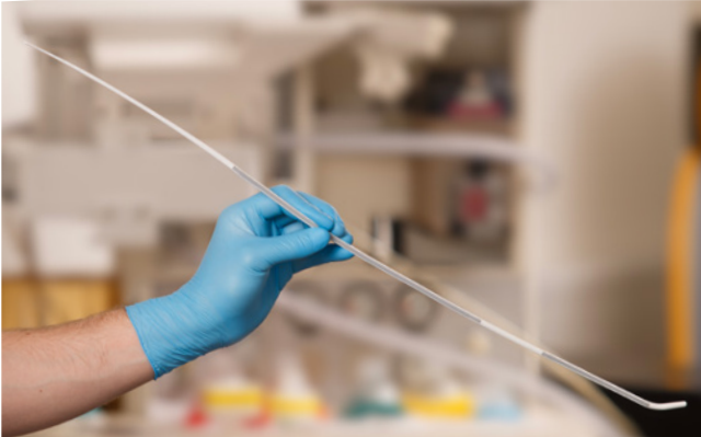
Como introductor estándar.