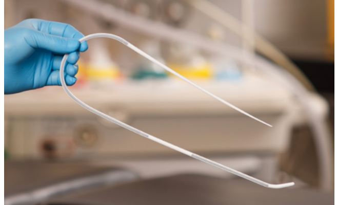
Como introductor estándar, pero con el USB conservando su forma original. El usuario puede insertar el dispositivo con esta forma para conservar la direccionalidad y a continuación cargar el TET sobre el USB cuando esté correctamente colocado.