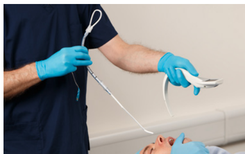
Uso del USB como introductor