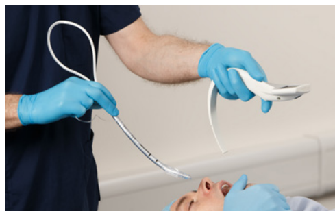
Uso del USB como estilete