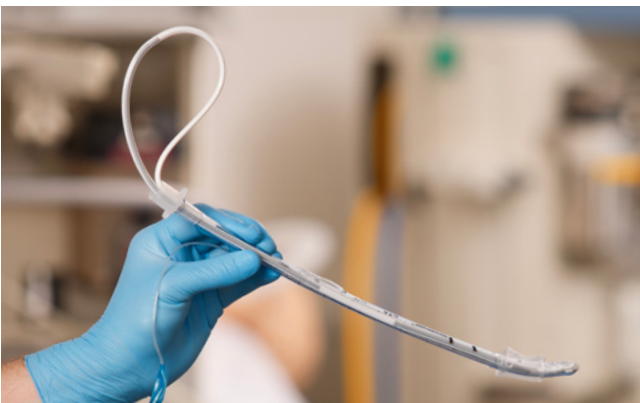
Recto hasta el balón.