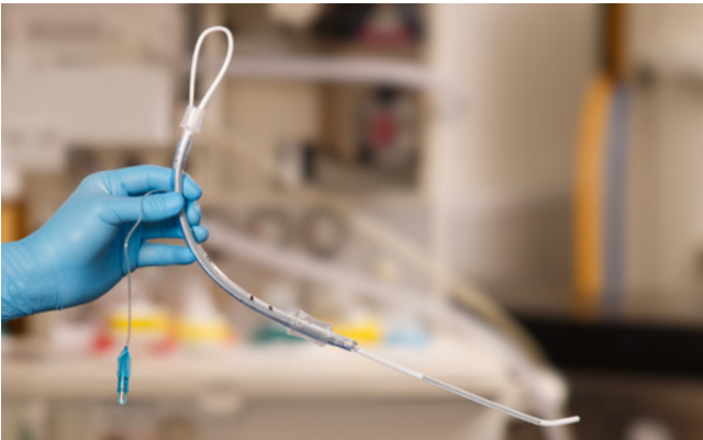
El TET puede pre-colocarse en el USB de manera que el extremo del tubo quede en el punto donde empieza la segunda sección maleable (identificada por las secciones grises). El extremo proximal del USB puede doblarse y meterse en el conector del TET para que no se mueva accidentalmente. Una vez que el USB se ha colocado correctamente, el TET se dirige sobre el USB de forma habitual.